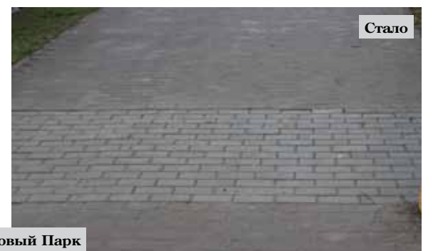
Улица Липовый Парк