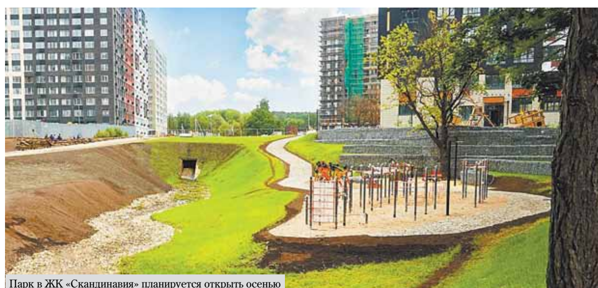
Парк в ЖК «Скандинавия» планируется открыть осенью