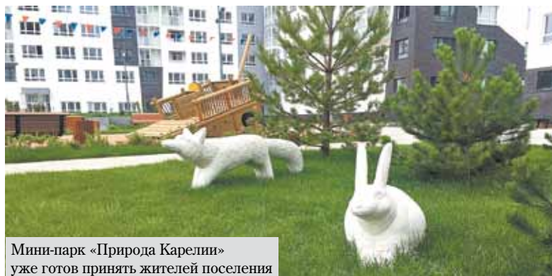
Мини-парк «Природа Карелии» уже готов принять жителей поселения

Сразу два новых городских парка появятся этой осенью и в жилом массиве поселения. В составе ЖК «Белые ночи» уже готов мини-парк «Природа Карелии», а в ЖК «Скандинавия» завершаются работы по обустройству зеленой зоны со скандинавским акцентом.