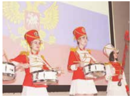
Окончание. Начало на стр. 1.

В продолжение праздника выступили творческие коллективы. Зрителей порадовал вокальный ансамбль «Алькор», эстрадная студия «Вокс» Дома культуры «Коммунарка», хореографический ансамбль «Чижовники» и секция спортивно-эстрадных танцев: совсем юные артистки смотрелись невероятно трогательно и буквально